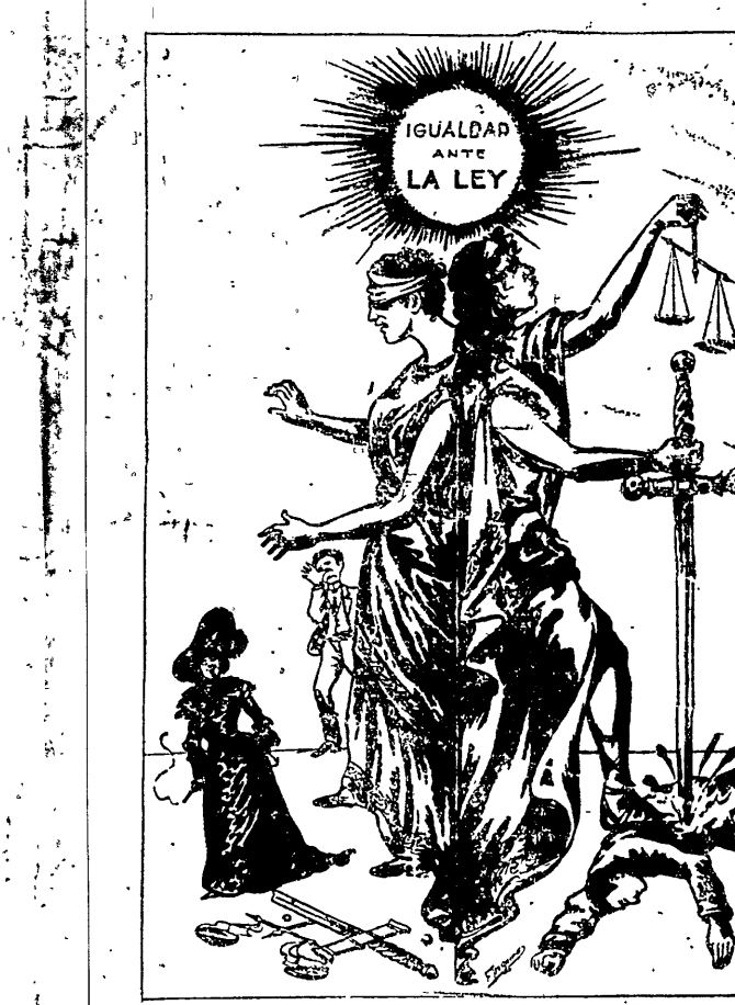
Para los ricos. Para los pobres. (De Vida Nueva)

internacional para la protección del trabajo, y se establecieron las bases de una ley internacional que impidiera el uso del fosforo blanco y amarillo en la fabricación de fósforos, y para abolir el trabajo nocturno de las mujeres.